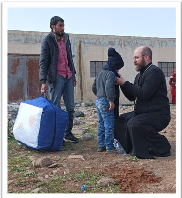
夥伴為孩童穿上保暖衣物。