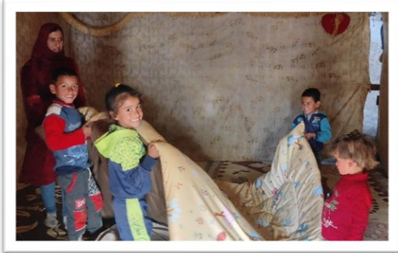
住在帳篷裏的受惠家庭獲發毛毯。