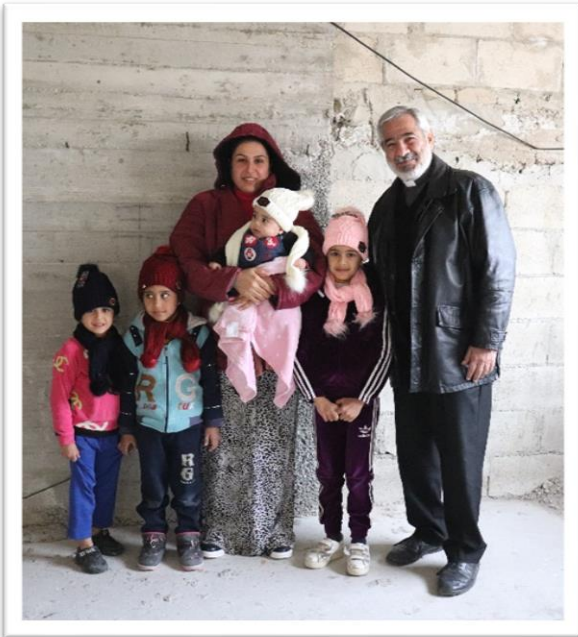
孩童們穿上針織帽及圍巾後倍感溫暖。