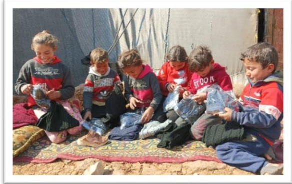
孩童們收到保暖衣物均莞爾一笑。